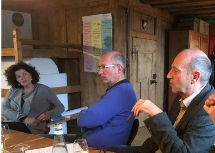
Sitzung der Steuerungsgruppe in Montan, Südtirol