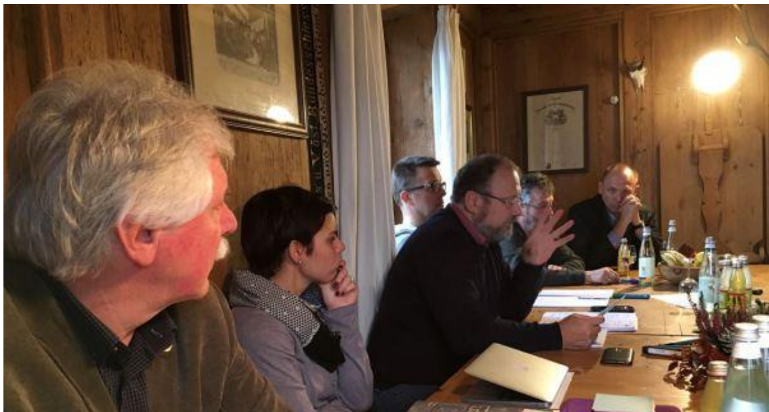
Eindrücke aus der Arbeit der Steuerungsgruppe