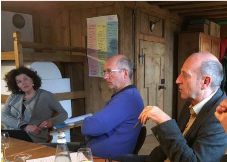
Sitzung der Steuerungsgruppe in Montan, Südtirol