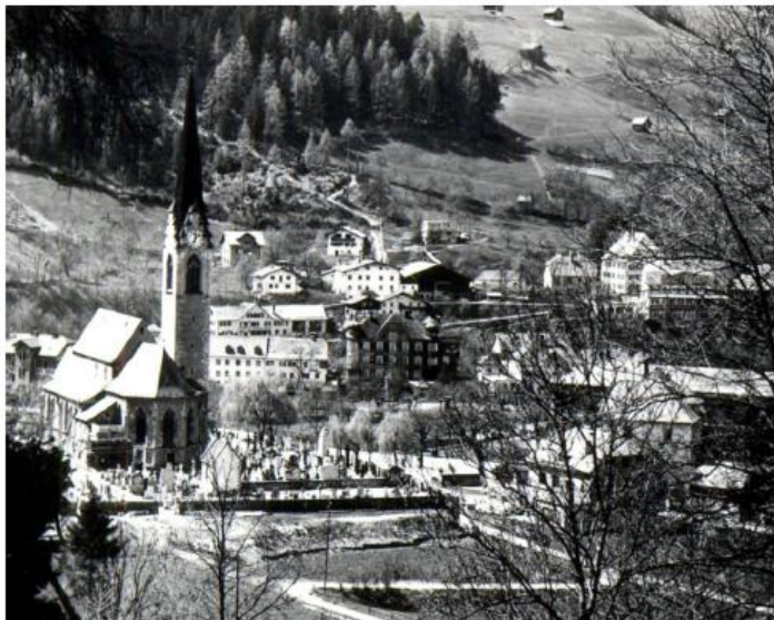
Die Kapelle im Jahr 1955 nach der ersten Friedhofs- erweiterung.