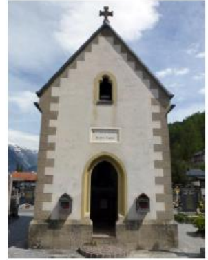
Ansicht von Friedhof und Herz-Jesu-Kapelle im Jahr 1920.