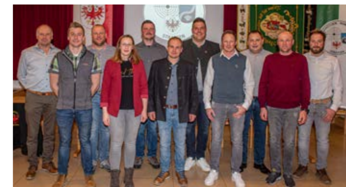
Kompanieausschuss der Schützenkompanie Strassen