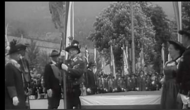
26. Mai 1963: Landeshauptmann Hans Tschiggfrey übergibt den Tiroler Schützen die Bundesstandarte. Seitdem rückt die Bundesstandarte nur bei besonderen Anlässen landesweiter Bedeutung aus. Bei einem Landesüblichen Empfang mit Beteiligung aller Landesteile Tirols stehen die Bundesfahnen des Süd- und Welschtiroler Schützenbundes – zum Zeichen der Landeseinheit – neben der Bundesstandarte.