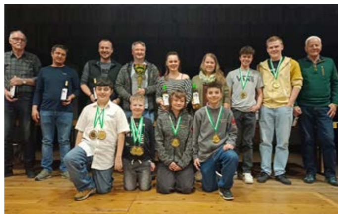
Die Klassensieger des Talschaftsschießen Landeck in Pians