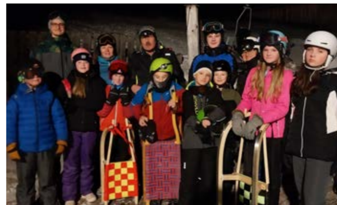
Gruppenfoto der Jungschützen beim Rodelausflug