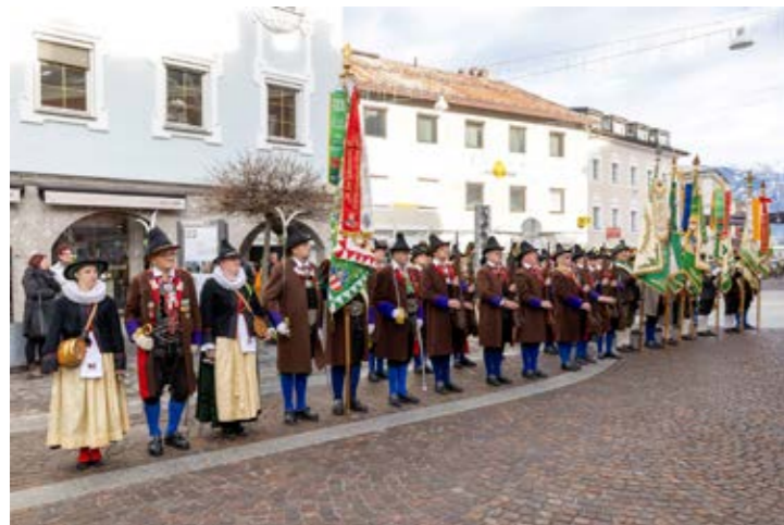
Landesüblicher Empfang mit Ehrenkompanie Lienz