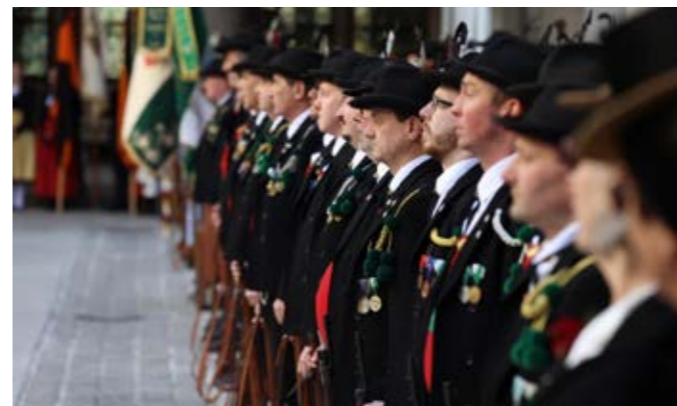
Unten: 1. Schwazer Schützenkompanie