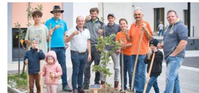
Jungschützen und Schützen der SK Kolsassberg vor dem gepflanzten Eichenbaum

Am 20.10. setzten die Jungschützen der orig. Rettenberger Schützenkompanie einen Eichenbaum vor der Gemeinde Kolsass. Die Eiche steht unter anderem für Standhaftigkeit, Ehrlichkeit und Treue. Werte, die bei den Schützenkompanien vermittelt und gelebt werden. Grünes Eichenlaub zierte den Trachtenhut der orig. Rettenberger Schützenkompanie. In ferner Zukunft sollen die Blätter von diesem Baum die Hüte bei den Ausrückungen schmücken. Ein ganz besonderer Dank gilt der Gemeinde Kolsass, dem Sponsor des Baumes Gerüstebau Stöger, den Jungschützen und allen fleißigen Helfern, die diese Baumpflanzaktion unterstützt haben.