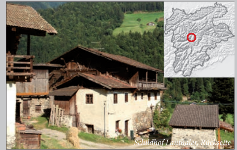
Schildhof Lanthaler, Rückseite

https://commons.wikimedia.org/wiki/Category:Schildh%C3%B6fe_in_Passeier?uselang=de