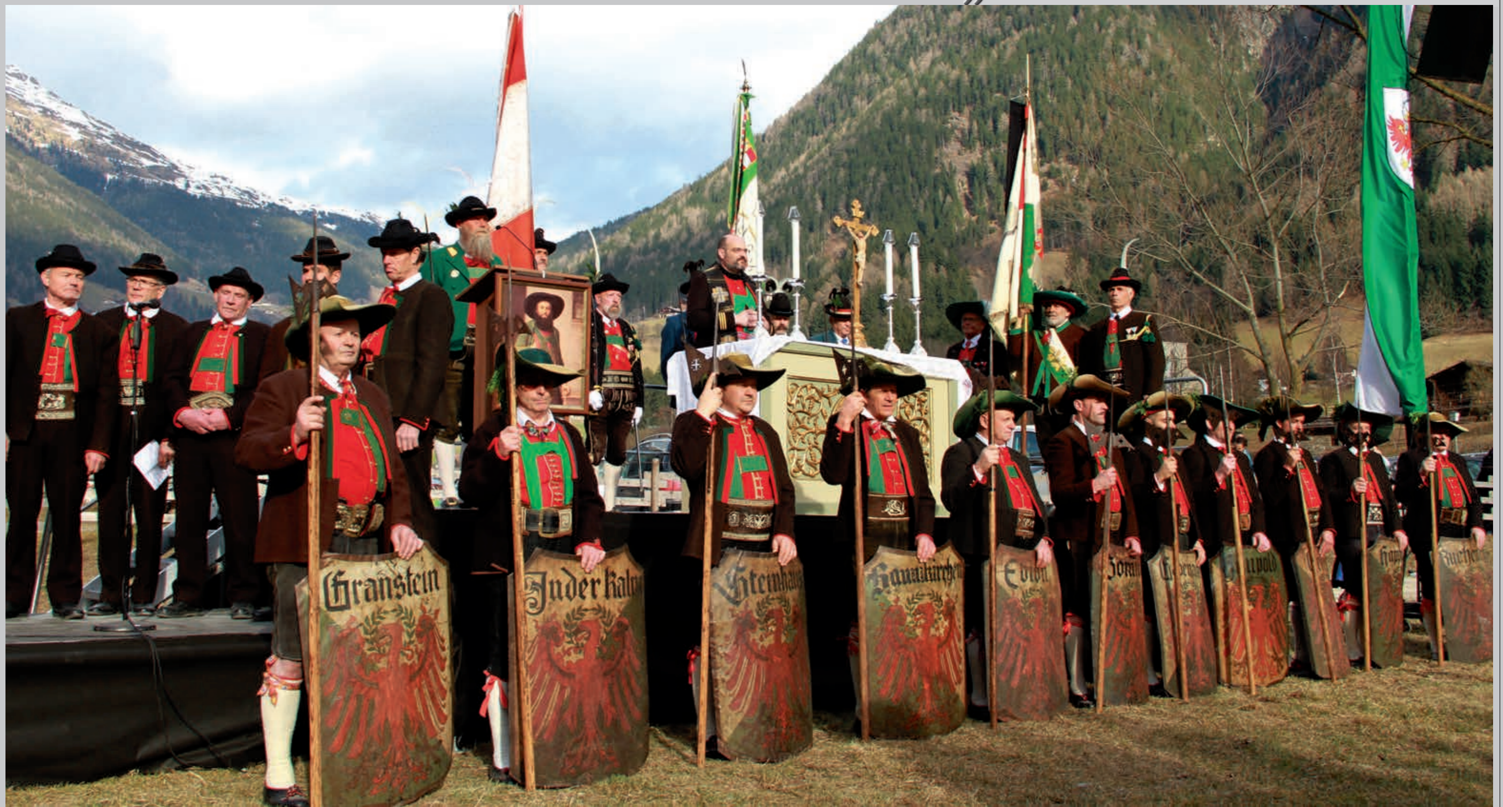
Die Schildhofbauern im Passeier hatten ab Ende des 13. Jahrhunderts für einige Jahrzehnte eine Sonderstellung in Rechten als auch Pflichten und gelten noch heute als besonders geschichts- und traditionsbewusst.