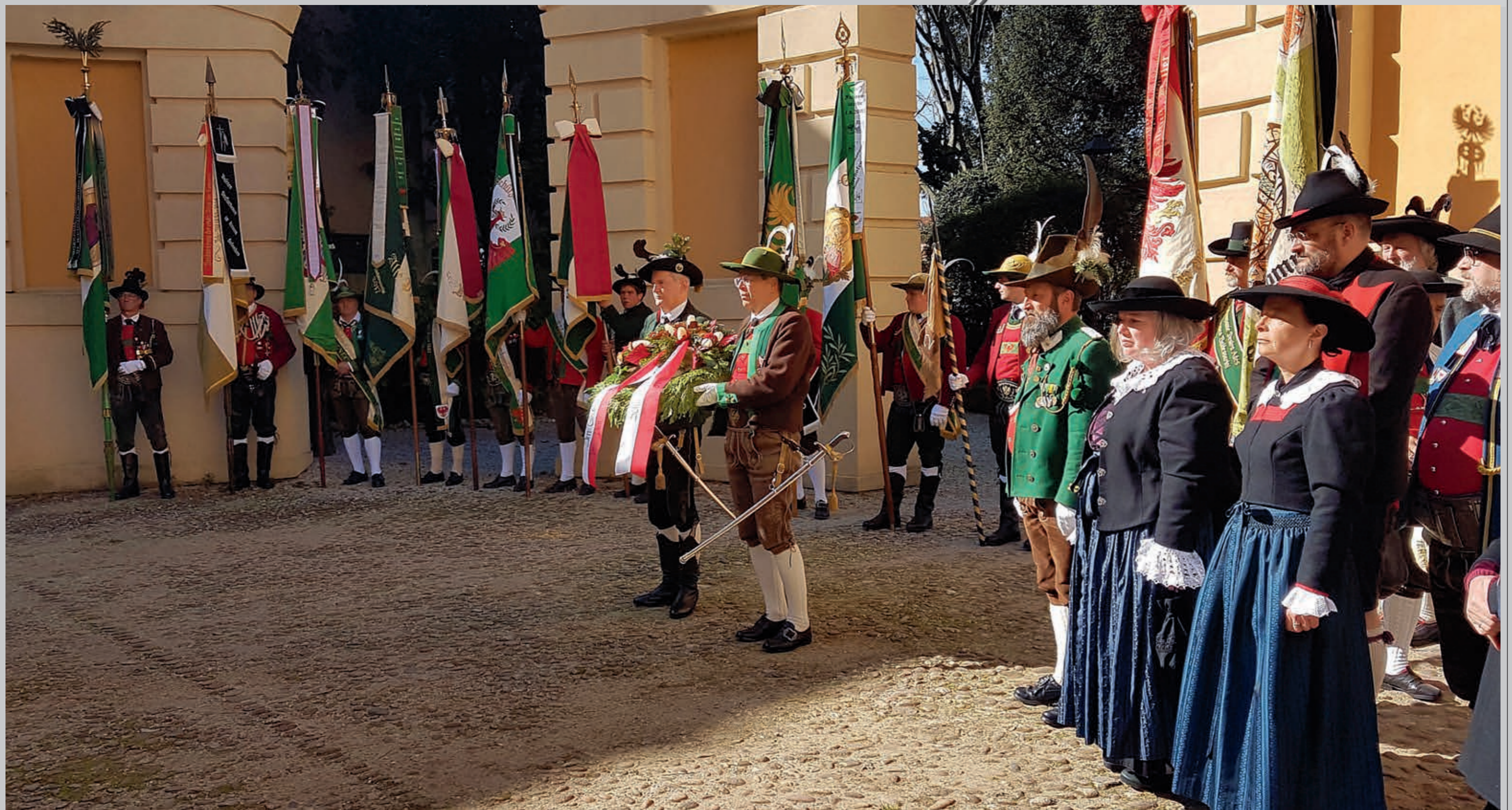
Die Kranzniederlegung im Innenhof des Palazzo d'Arco in Mantua, dem Schauplatz der Gerichtsverhandlungen gegen Andreas Hofer im Jahr 1810, ist alljährlich ein feierlicher Moment.