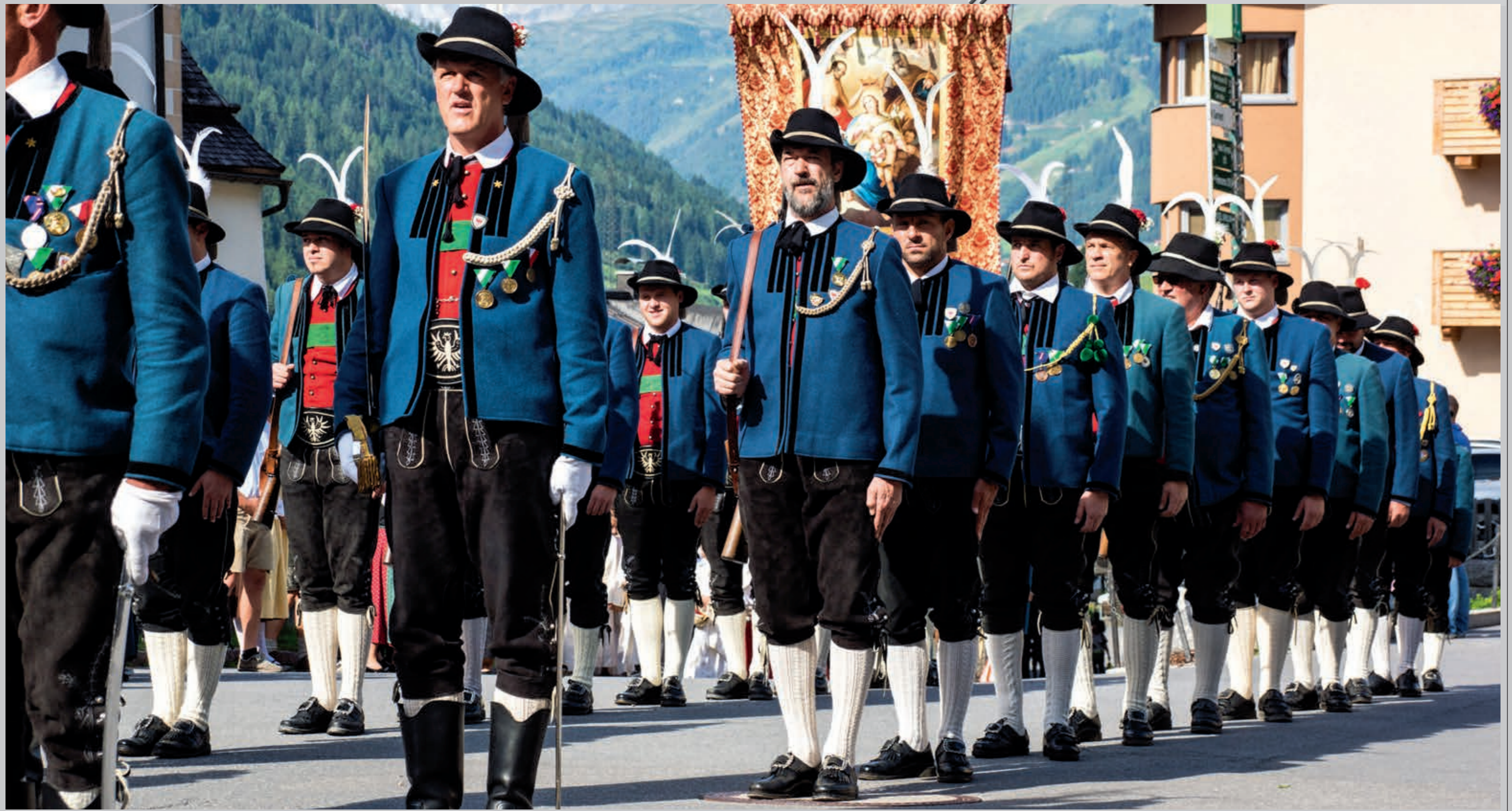
Die Schützenkompanie Pettneu am Arlberg „Abt Sebastian Stöckl“, welche im Namen dem bekannten Prälaten vom Stift Stams gedenkt, der im Gasthof Schwarzer Adler in Pettneu geboren wurde.