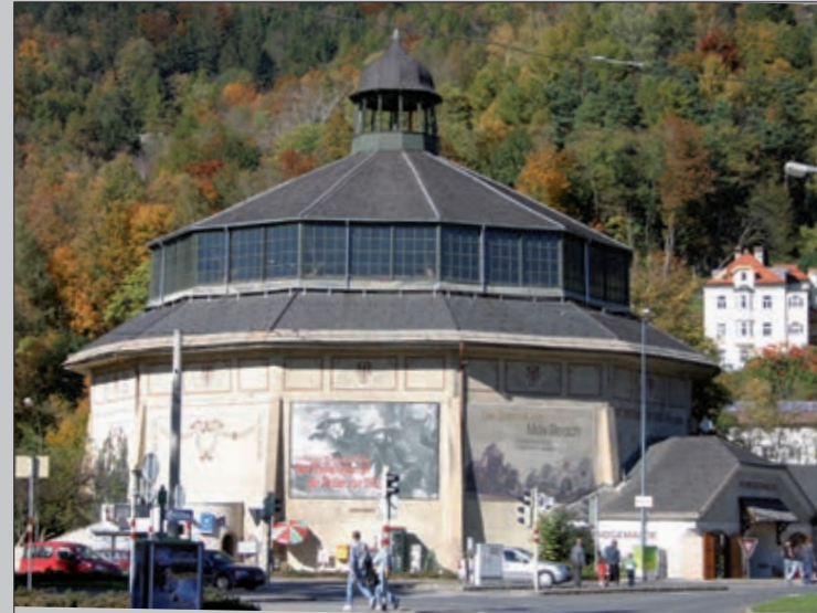
Die Rotunde, Standort des Innsbrucker Riesenrundgemäldes von 1907 bis 2010.

Das Riesenrundgemälde ist eines von weltweit 28 noch existierenden Panoramen aus der Zeit vor dem Zweiten Weltkrieg. Auf mehr als 1.000 Quadratmetern werden im Riesenrundgemälde die Ereignisse der dritten Schlacht am Bergisel vom 13. August 1809 dargestellt: 15.000 bayrische, sächsische und französische Soldaten unter der Führung des französischen Marschalls Lefèbvre standen einem ebenso großen Tiroler Schützenaufgebot unter Andreas Hofer gegenüber.