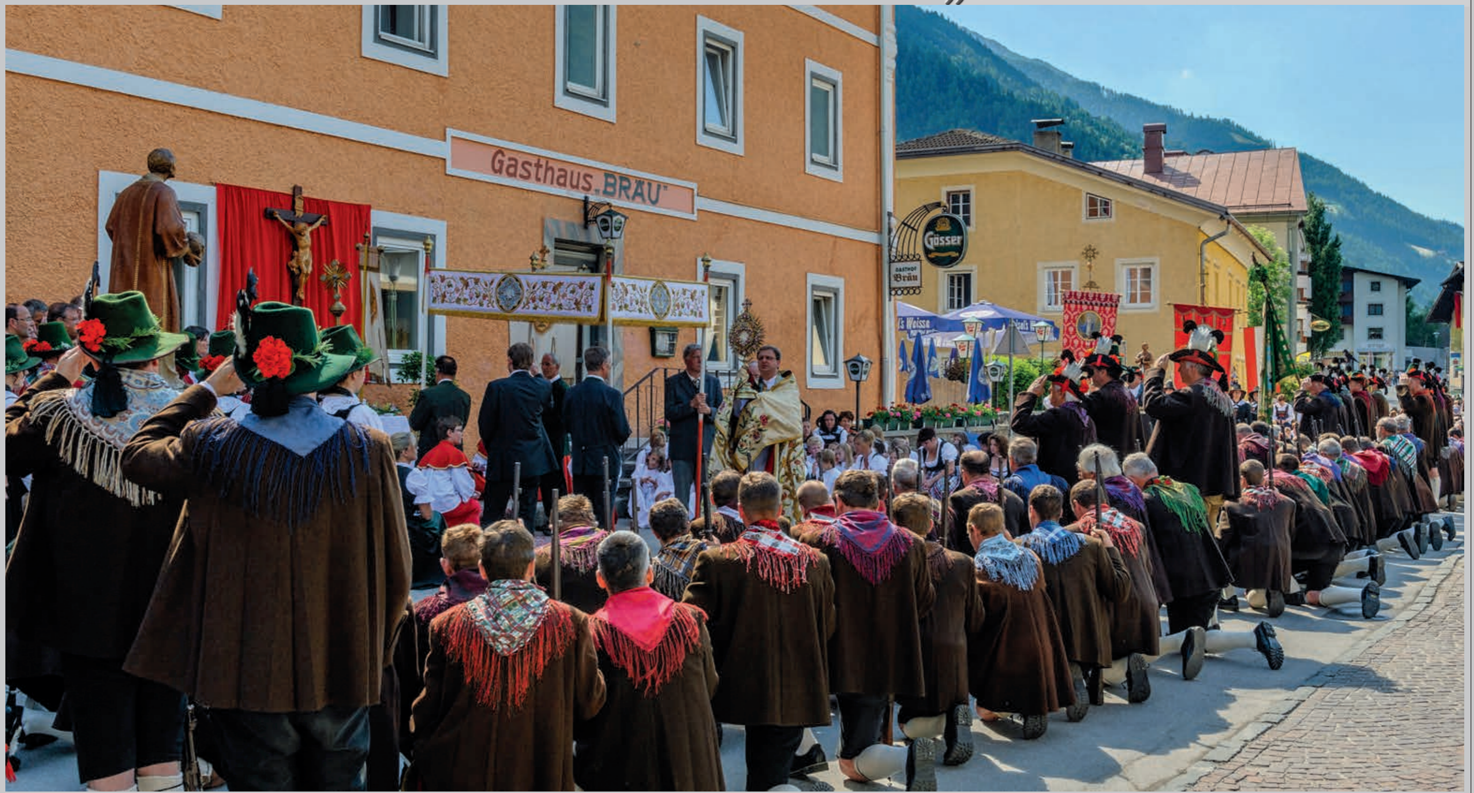
Die Kranztlage im Sommer haben für Matri in Osttirol eine ganz besondere Bedeutung, sodass zu diesem Anlass ausgesprochen viele Schützen der größten Kompanie des ganzen Landes ausrücken.