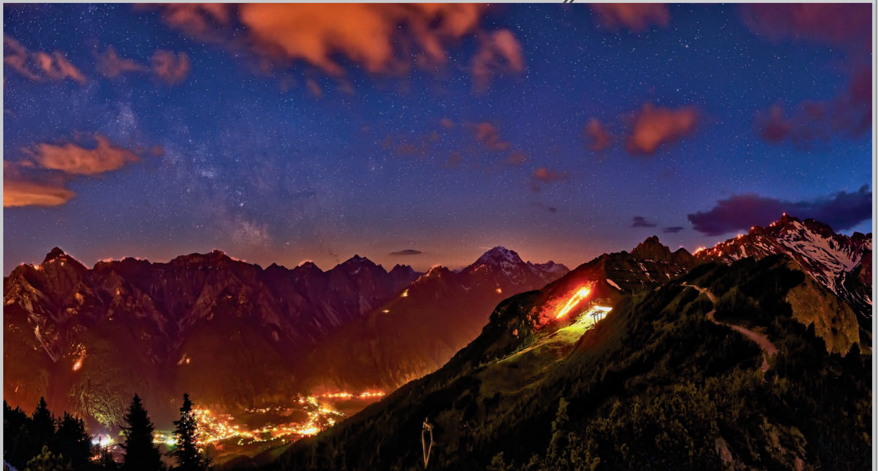
Die Herz-Jesu-Feuer auf den Bergen in ganz Tirol – Ausdruck einer tiefer Verbundenheit mit diesem Land und seiner Geschichte.