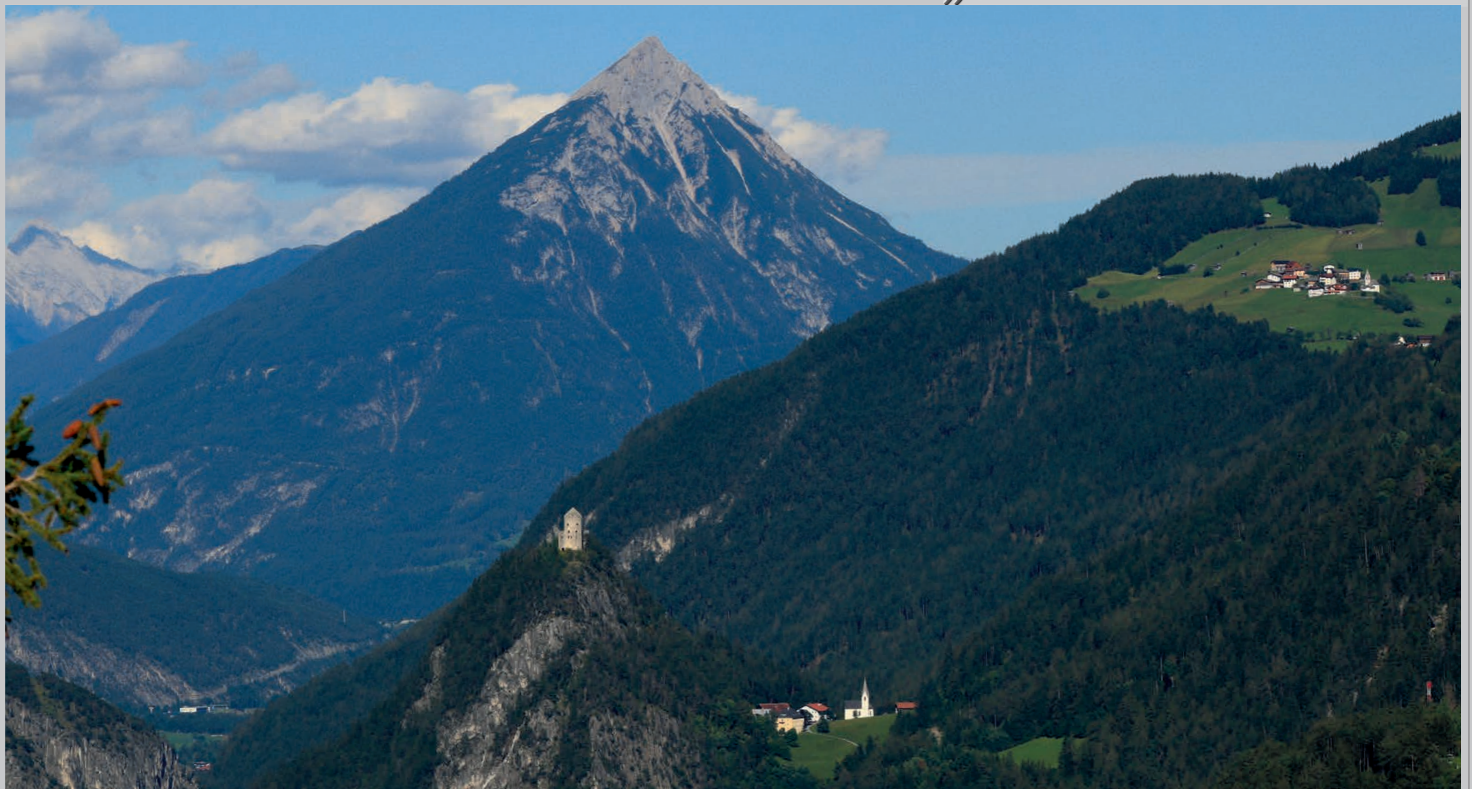
Die Ruine Kronburg samt Wallfahrtsort im Oberinntal, überragt vom charakteristischen Tschirgant; oben rechts der Weiler Falterschein, Gemeinde Zams.